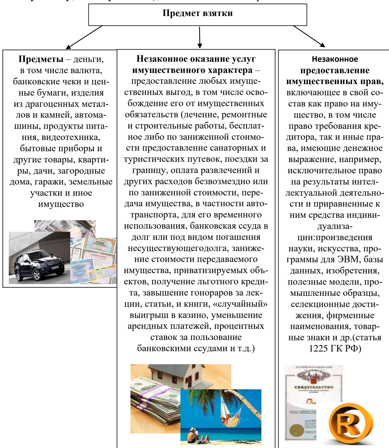
Рис.2 Предмет взятки

Взятка может быть предложена как на прямую («если вопрос будет решен в нашу пользу, то получите...»), так и косвенным образом.