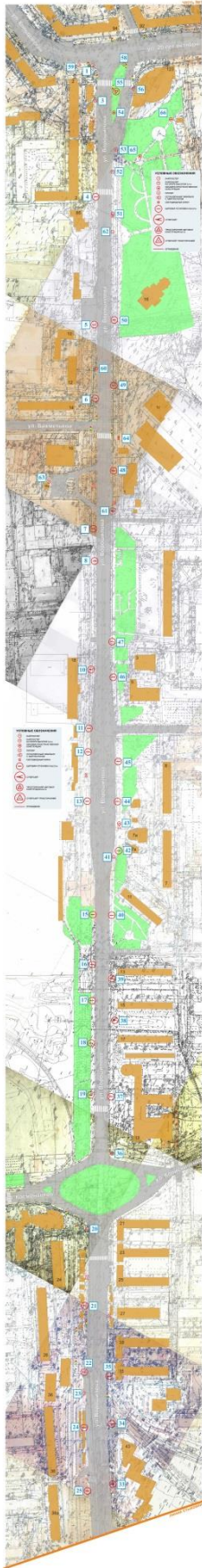
СХЕМА РАЗМЕЩЕНИЯ РЕКЛАМНЫХ КОНСТРУКЦИЙ НА ТЕРРИТОРИИ ГОРОДСКОГО ОКРУГА ГОРОД ВОРОНЕЖ ДЛЯ УЧАСТКА ТЕРРИТОРИИ: улица Ворошилова М 1:1000